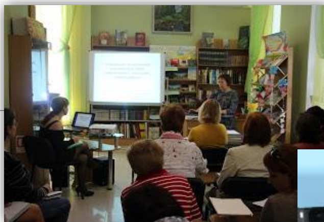
Херсонська ОДБ ім. Дніпрової Чайки