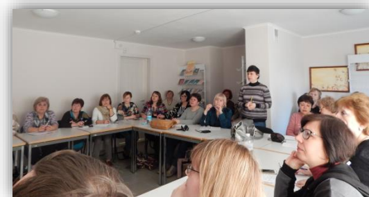
НБУ для дітей

Навчання працівників бібліотек для дітей