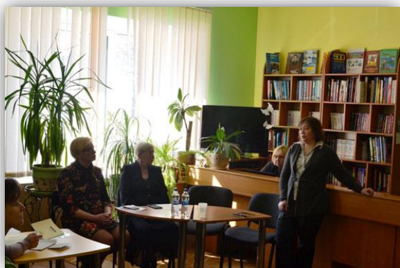
Вінницька ОДБ ім. І. Я. Франка