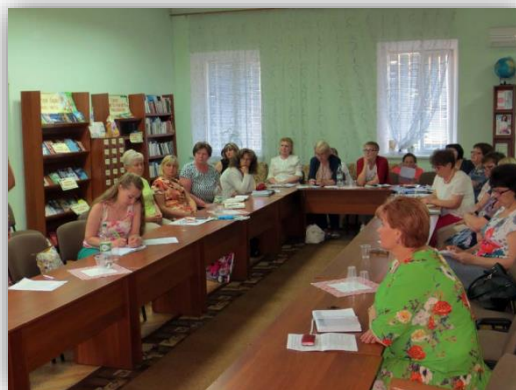
Миколаївська ОДБ ім. В. Лягіна